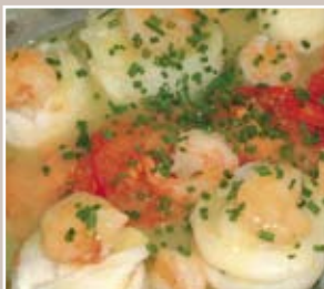
cuisiner au micro-ondes (p. 6)