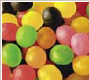
les additifs dans l'alimentation