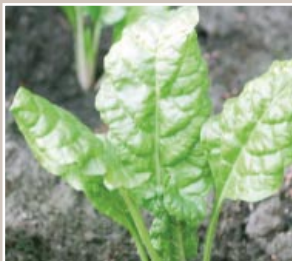
légumes et nitrates (p. 8)