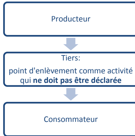
Figure 1 : exemple d'une livraison B2C, du point de vue du producteur

Afin de déterminer si la livraison avec l'intervention d'un tiers est considérée comme une livraison B2B ou B2C, il faut vérifier si le tiers exerce une activité qui doit être déclarée auprès de l'AFSCA.